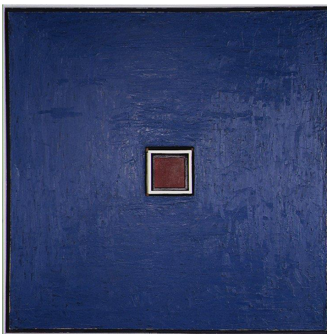
3.5. att. Sols Levits. Sienu konstrukcija “Blue” 3